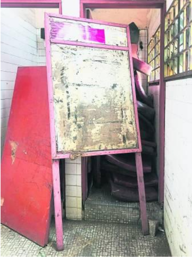
舞台前斑剥的看板。