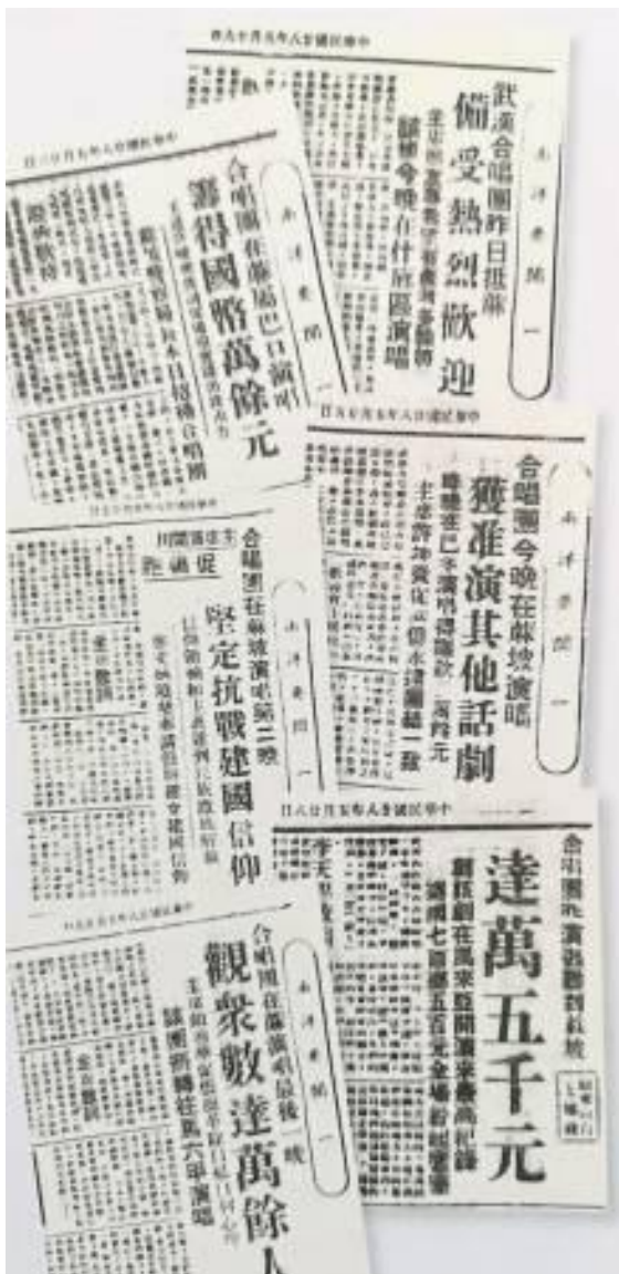
中国武汉合唱团在新民舞台演出的系列报导。