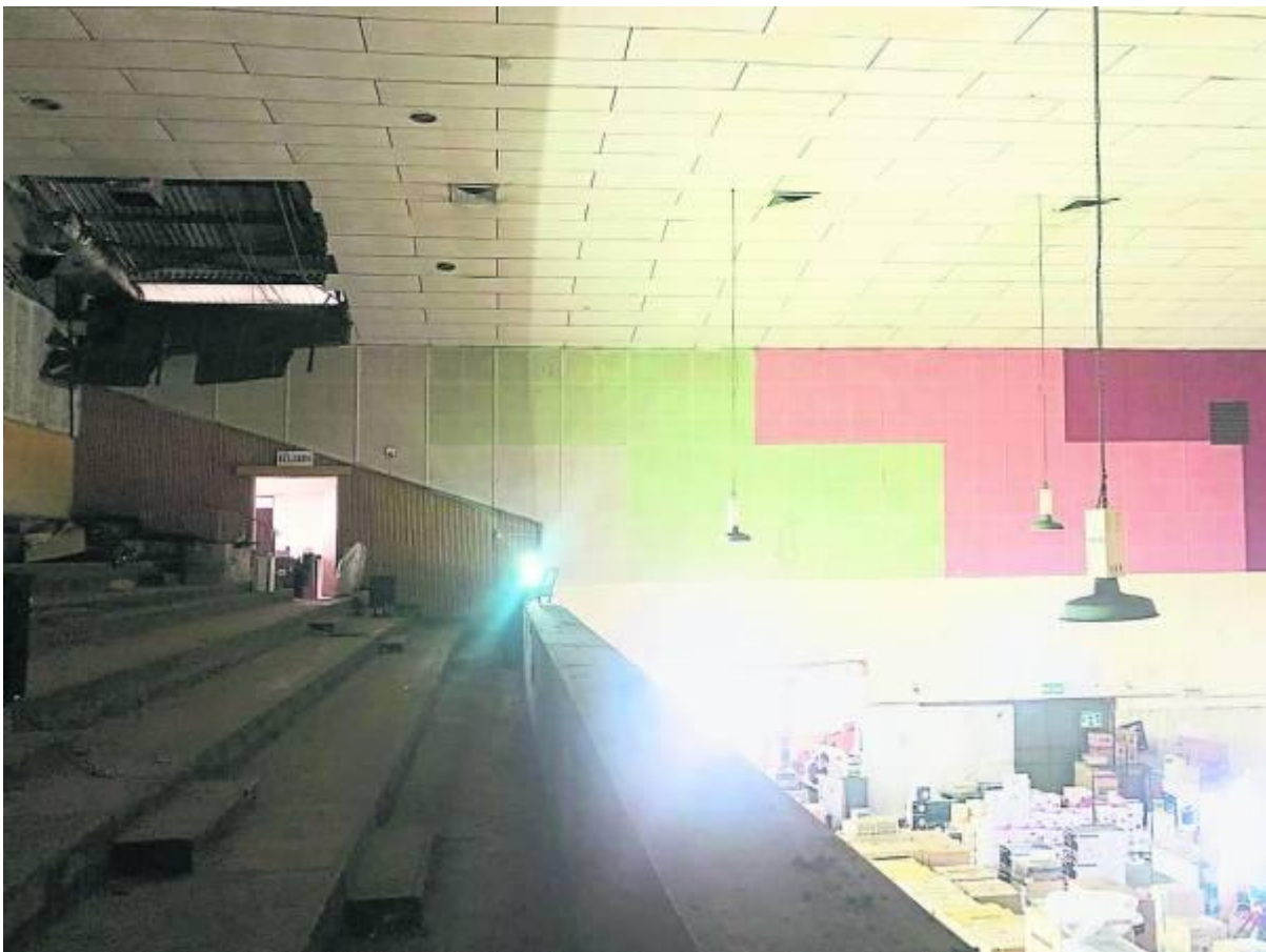
舞台保留旧有的台阶。