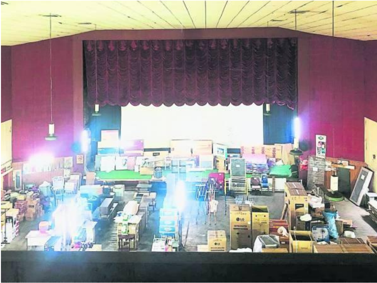
辉煌一时的新民舞台，现成为电器行储藏室。